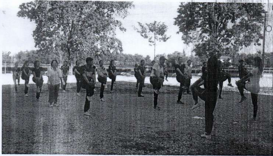
(๒) กิจกรรมจิตอาสาเราทำความดีด้วยหัวใจ